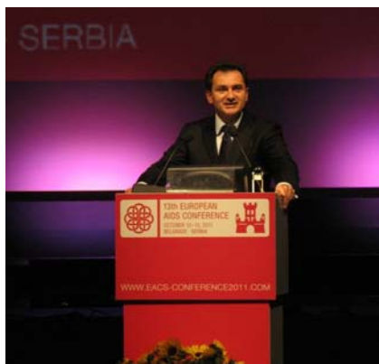
Vizepremier Božidar Đelić

Diskutieren westeuropäische Forscher und Community-Aktivisten über die Einsatzmöglichkeiten von Kombinationspräparaten wie Truvada® für die Präexpositionsprophylaxe (PrEP), so sind diese neueren Medikamente in Ländern wie Serbien noch nicht einmal für die Therapie erhältlich. So räumte auch Serbiens Vizepremier Božidar Đelić, ein, dass in seinem Land noch eine Menge Aufbauarbeit zu leisten sei, insbesondere auch bei der gesellschaftlichen Akzeptanz der knapp 5000 HIV-Positiven im Land.